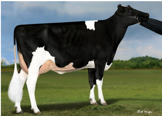
IHG LOTTOMAX TANIA THIRD DAM